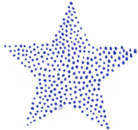
Nr. 2094 39 €