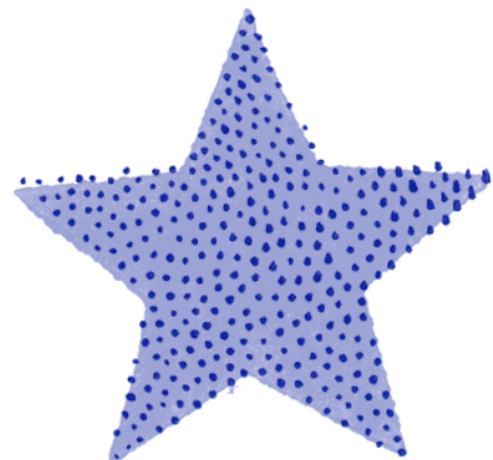
Nr. 2097 (Fläche) unter Nr. 2094 (Kontur)