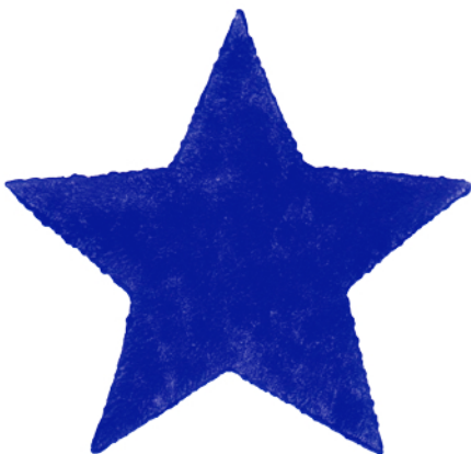
Nr. 2097 19 €