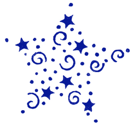
Nr. 2100 42 €