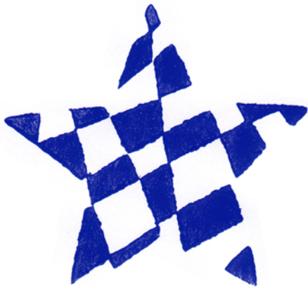
Nr. 2095 39 €